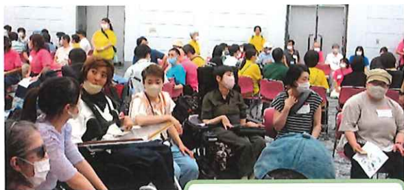
参加者のしゃべりば

が輪になって自己紹介をしたり、お互いに質問をしたりと直接話をする時間もありました。自治会の話やとりくみの話など、大変に盛り上がっていました。どちらの企画も他事業所のとりくみを知ることができるなど、貴重な時間になりました。